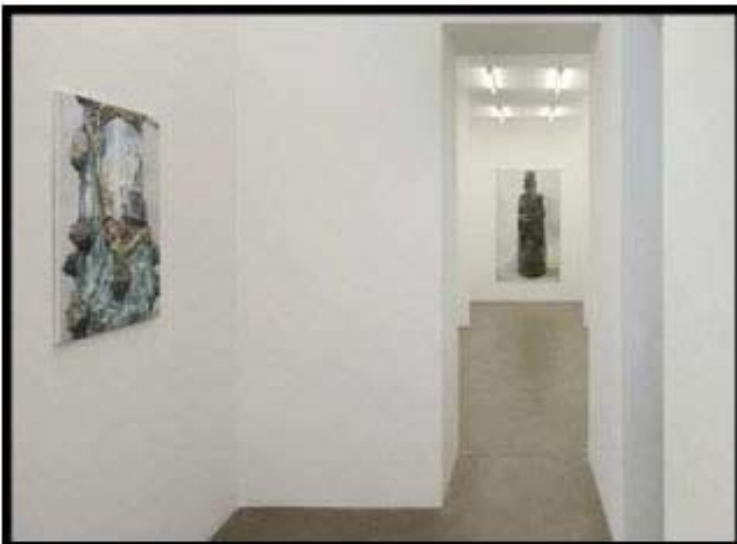
Paysage (l'étiquette) , 60x80cm, huile, toile, 2011