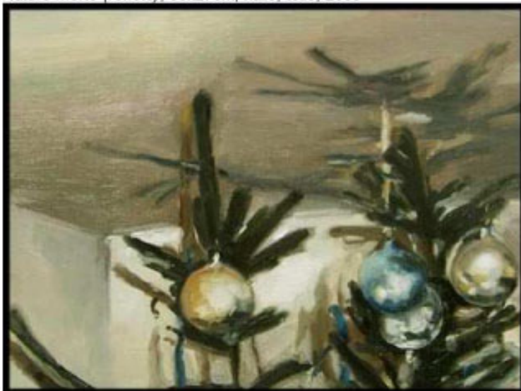
Forêt noire , 27x50cm, huile, toile, 2011

Nature morte (reflets) , 35x27cm, huile, toile, 2009