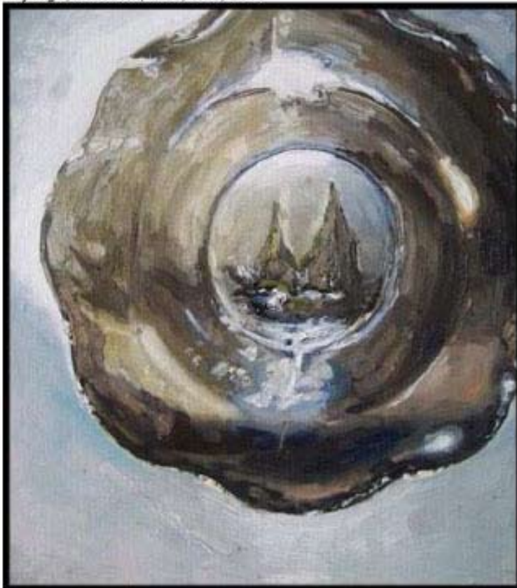
Astérie , 24x33 cm, huile, toile, 2011