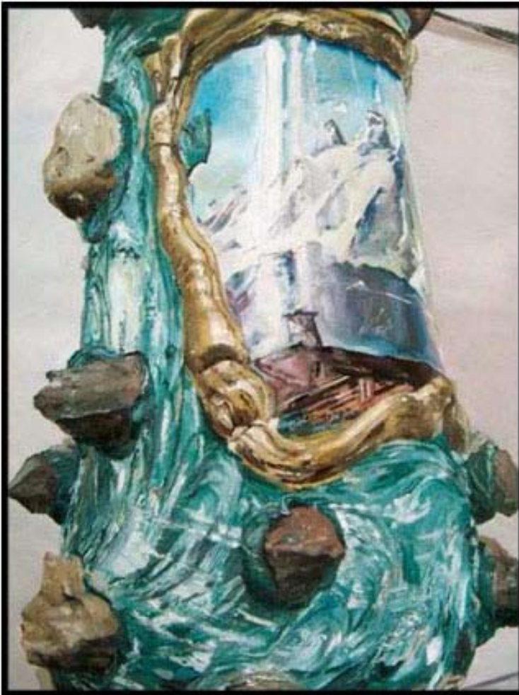
Exposition Presentis jusqu'au 5 mai 2012 à la Galerie Eric Mircher à Paris