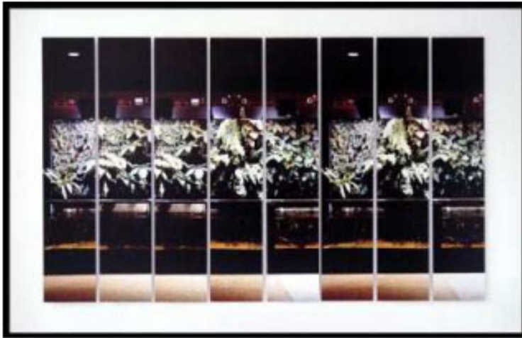
Exposition par Eva Nielsen avec Raphaël Barontini , Marion Verboom , Mireille Blanc , Chloé Dugit-Gros , Catalina Niculescu , Eva Nielsen , et Constance Nouvel jusqu'au 3 mai 2012 à la Galerie Dominique Fiat à Paris