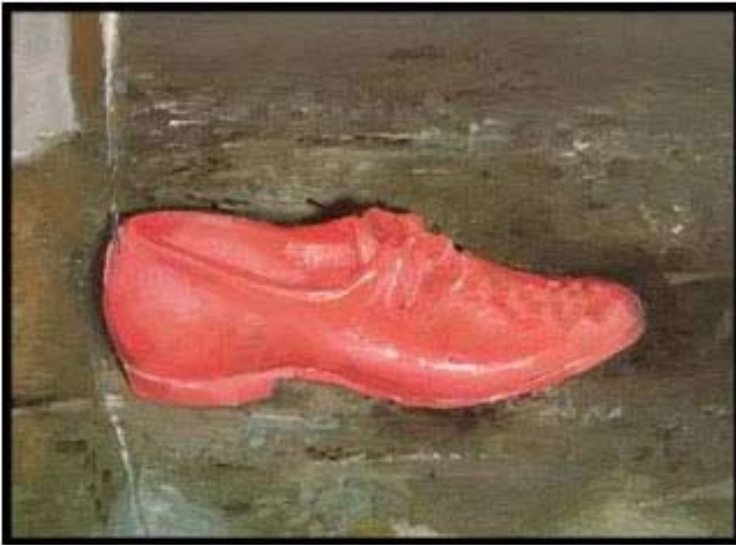
Mireille Blanc, Coussin , 38x50cm, huile, toile, 2012