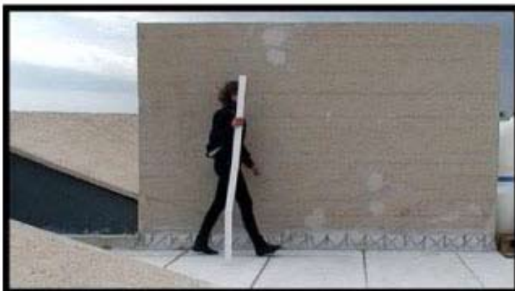
Marion Verboom, Digitale , 110x50x170cm, cire, métal, 2011