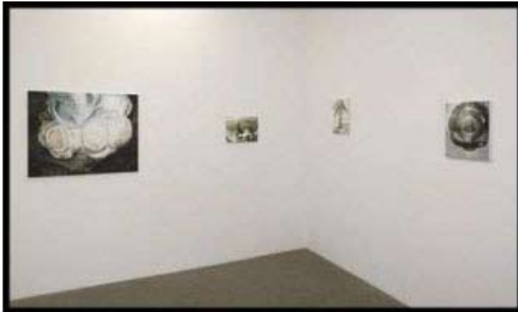
Paysage , 36x41 cm, huile, toile, 2010