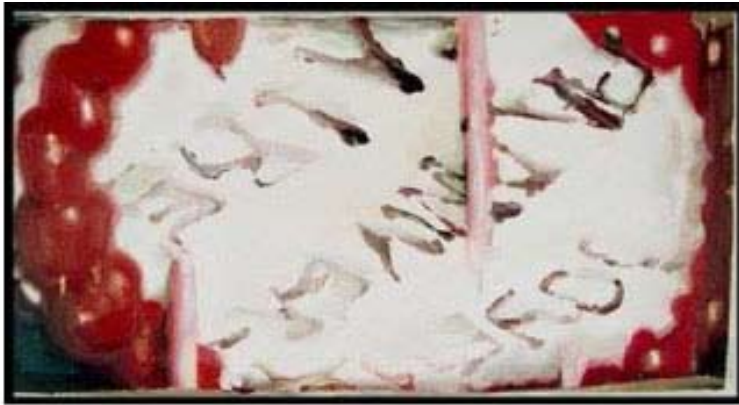
Décor (restes) , 30x38cm, huile, toile, 2011