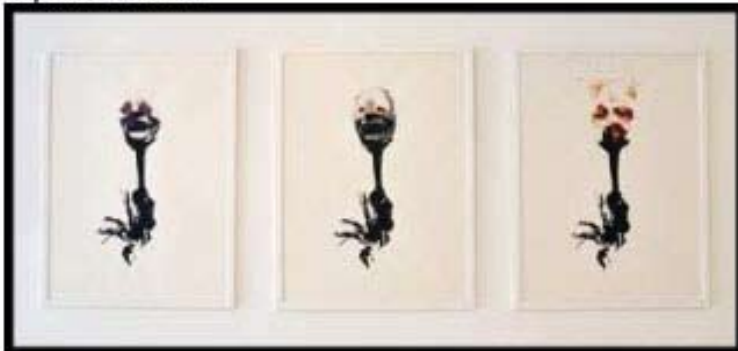
Constance Nouvel, Désordre , 150x247cm, tirages, aluminium, 2010