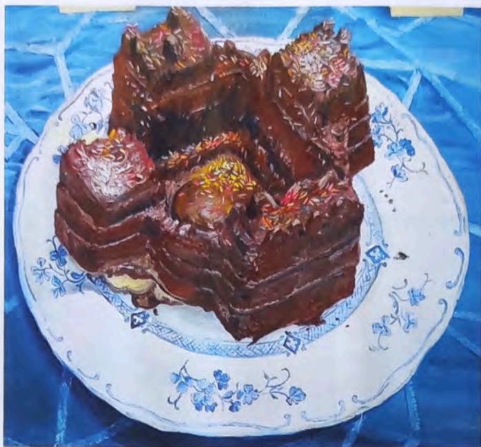
Mireille Blanc, Château , 2022, huile et sprays sur toile, 50 x 60 cm.